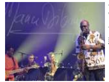
Pl / Arcs scène nationale