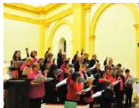
épige et Bémol