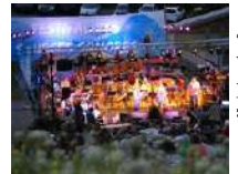
École de musique Faverges